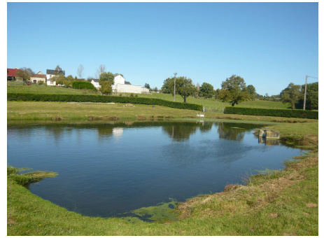
Lagune à Beyssenac

Par manque de moyens techniques et de personnel, un contrat d'affermage (renouvelé le 1 er Janvier 2008) a été établi, pour une durée de 12 ans, avec la SAUR pour le suivi et l'entretien de toutes les installations de la Communauté de Communes du Pays de Pompadour.