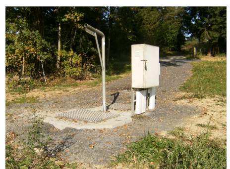
Relevage hippodrome à St Sornin