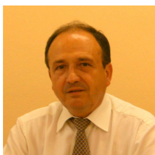
Maire de St SORNIN LAVOLPS