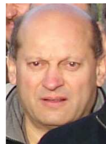
Maire de TROCHE