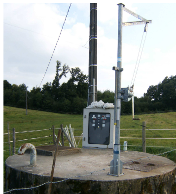
Relevage Vassagnac à Pompadour