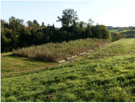
Filtre de roseaux à Beyssac