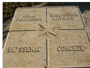
La pierre des 4 communes

Bulletin d'informations de la Communauté de communes du Pays de POMPADOUR n°1 – Décembre 2008 - Tirage : 2200 exemplaires GDI imprimeur (Pompadour) – Photos : Communauté de communes du Pays de Pompadour