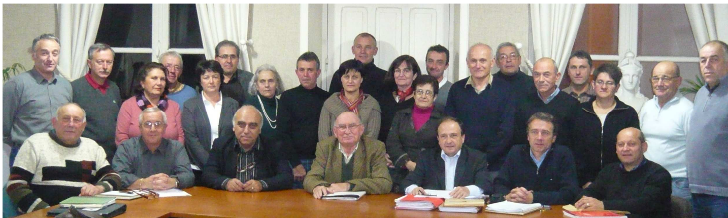
Les élus du Conseil communautaire 2008 - 2014

La Communauté de communes du Pays de Pompadour comprend 6 communes pour une population de 4 380 habitants et elle s'étend sur 10 320 hectares.