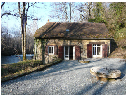
Le Moulin de la Résistance (Beyssenac)

Virement provenant de la section de fonctionnement : 152 640 €