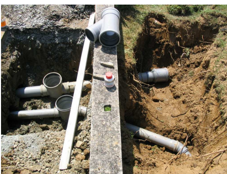
Boîte de branchement