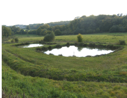
Lagune de Tugeat à Troche