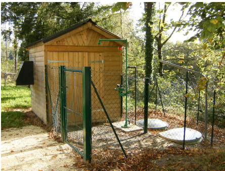
Relevage St Sornin

3 Lagunes : lagune de Tugeat (Troche) ; lagune route de Vigeois (Troche) ; lagune de Beyssenac.