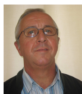
Maire de BEYSSAC

Les locaux de la Communauté de communes sont situés au 1 er étage du bâtiment de la mairie de Pompadour. Ils comprennent notamment 3 bureaux et une salle de réunions. Ils ont été aménagés par la Communauté de Communes en 2004 et ils sont mis à disposition par la commune de Pompadour, sans paiement de loyer.