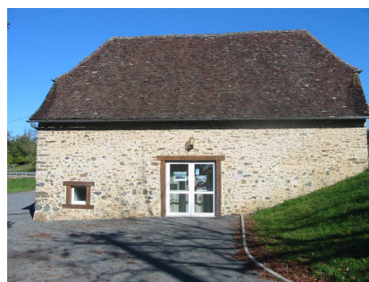
Le Moulin des Jeunes (Saint Sornin)