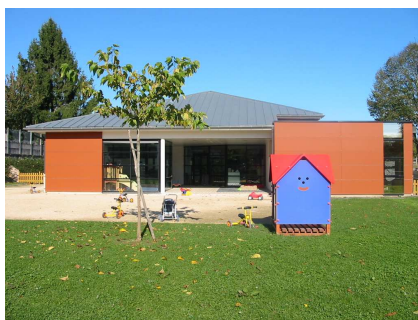
La Maison des Loupiots (Pompadour)