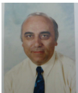
Maire de CONCEZE