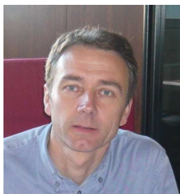
Maire de BEYSSENAC