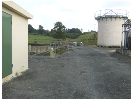
Station d'épuration à Arnac