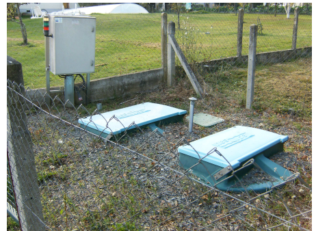
Relevage Croix du Loup à Troche